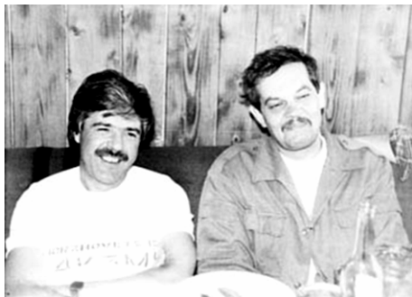
Слева направо: UY5XE и UB5LGM